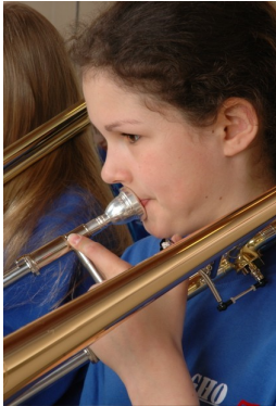
Musikunterricht der Jahrgangsstufen 5/6 als Bläserklasse

Die Bläserklasse ist eine andere Form des Musikunterrichts. Es handelt sich um einen auf zwei Schuljahre hin angelegten Klassenmusizierkurs, der als dreistündiger Musikunterricht am AMG angeboten wird. Alle Schülerinnen und Schüler lernen dabei zeitgleich und gemeinsam ein Orchesterblasinstrument.