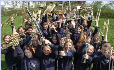
Bläserklasse - Wir sind am Zug!

Weitere Informationen erhalten Sie auf Anfrage bei den Musiklehrerinnen des AMGs.