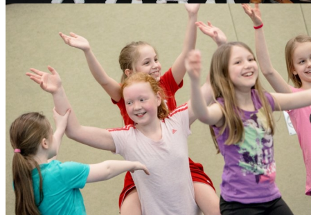
Weihnachtstheater / Sportunterricht