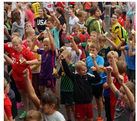
Warm up zum Sponsorenlauf 2018

Am AMG wird Vielfalt im Schulalltag gelebt. Wir sind Teil des Netzwerks „ Schule ohne Rassismus - Schule mit Courage “ und setzen uns für eine demokratische Schulkultur, für Toleranz, Menschenrechte, Geschlechtergerechtigkeit und gegen Rassismus, Homophobie und Diskriminierung ein. Unser Beratungslehrer(team) sowie unser Schulsozialarbeiter stehen für unterschiedliche Beratungsbedarfe jederzeit gerne zur Verfügung.